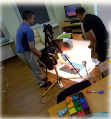
PRACA NAD FILMEM - KONKURS PFRON