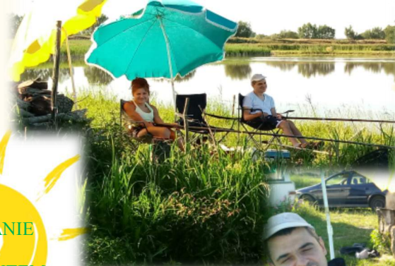
WYJAZD NA RYBY