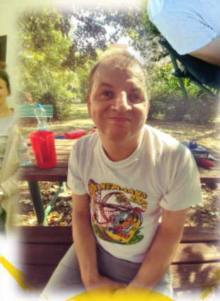
WYJŚCIA W POSZUKIWANIU CIENIA