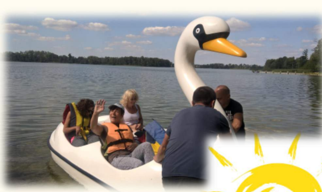
BIWAK W ŁUGACH